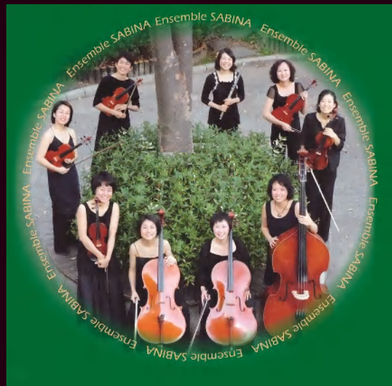
アンサンブル・サビーナ