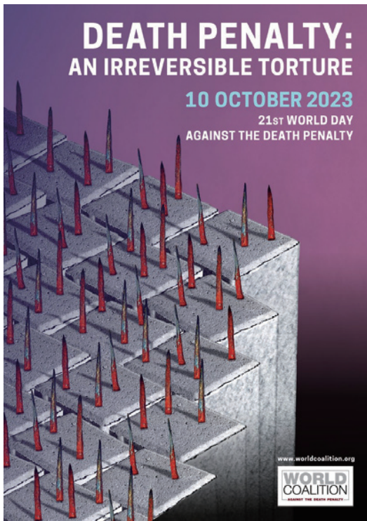
WDAPCの2023年版のポスター