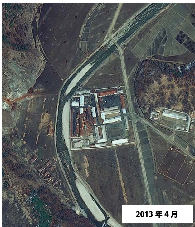
Natural Color Imagery, April 7, 2013, 39.689814°, 126.857436°