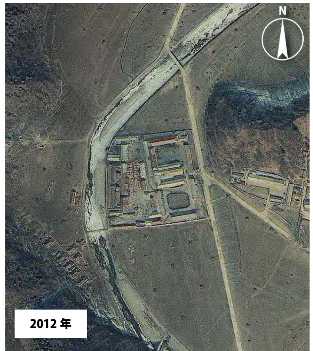
Natural Color Imagery, February 22, 2012, 39.689814°, 126.857436°