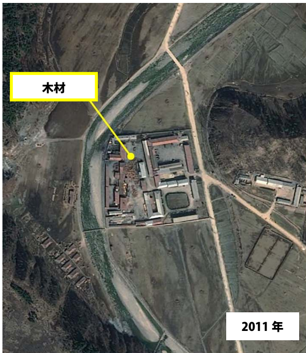
March 26, 2011, 39.689814°, 126.857436°

2011年から2013年にかけてヨドク収容所の同じ場所を写した画像を比べてみると、家具工場があると推定できる。木材の量の変化が、生産活動を示している。