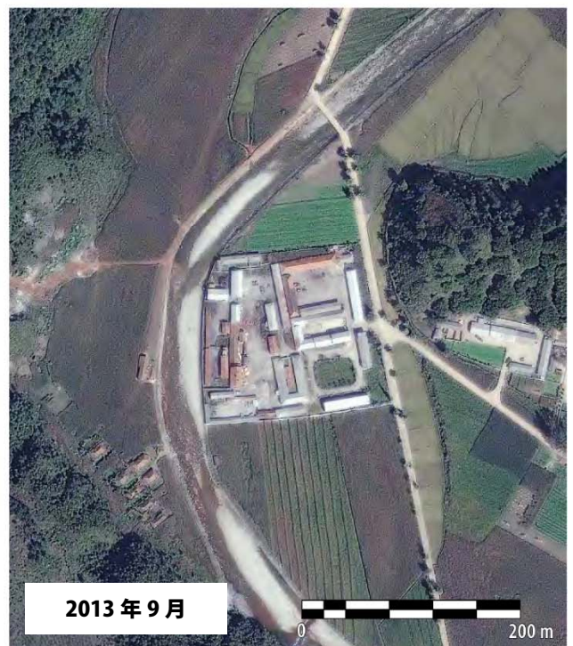
September 27, 2013, 39.689814°, 126.857436°