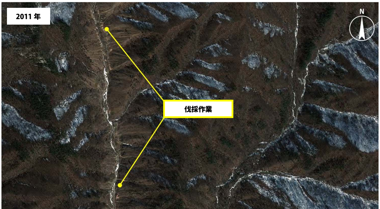
Natural Color Imagery, March 26, 2011, 39.836244°, 126.831452°

伐採は、どちらの収容所でも広範囲に見られる。下はヨドク収容所の画像だが、伐採作業が 2 年間継続して行われていることがわかる。(P 10 全景写真のエリア 8)