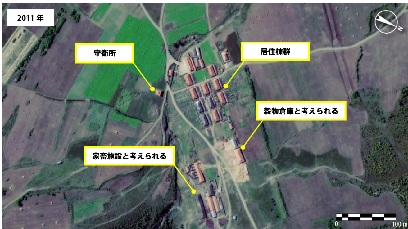
DigitalGlobe Natural Color Imagery, September 23, 2011 , 41.385843°, 129.101535°