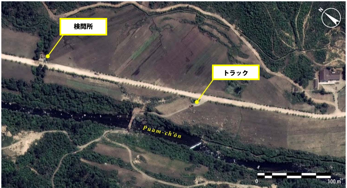
June 11, 2010, 41.301995°, 129.363418°

敷地内の移動も制限されているようである。2010年6月に撮られた第16号収容所の画像（下）には、検問所が写っている。