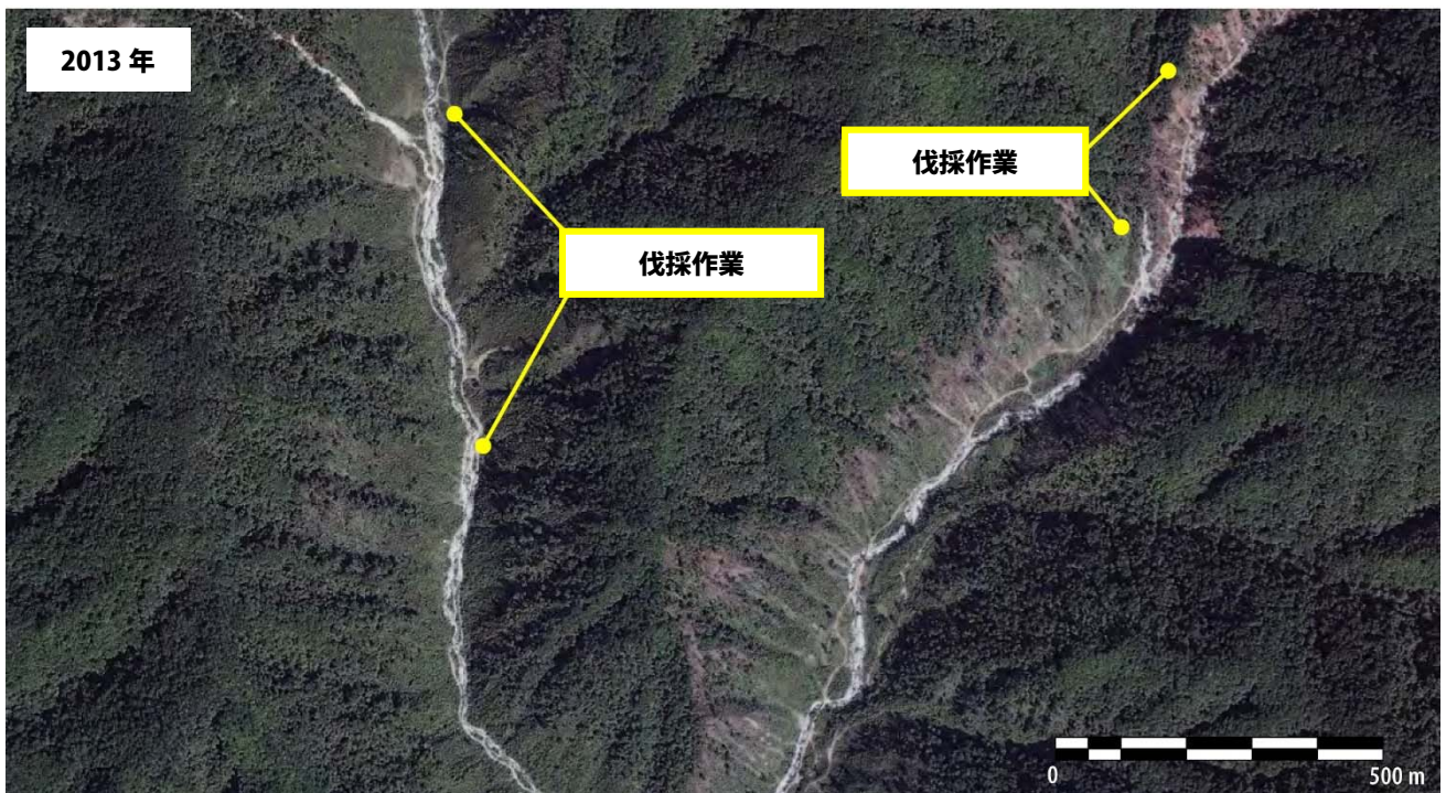
Natural Color Imagery, September 27, 2013, 39.836244°, 126.831452°